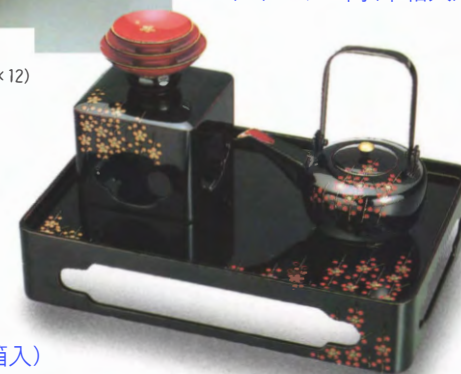
⑨⑥ 溜 屠蘇器 立梅 (台37.5×25×7.5) (96) 84,700円(化粧箱入)