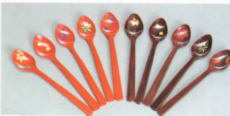
⑤⑦朱 スプーンセット 花尽し ⑤⑧溜 スプーンセット 花尽し (13.5×2.5×1.5)