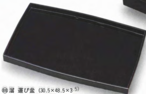
⑧⑧ 溜 運び盆 (30.5×48.5×3.5)