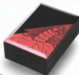
⑧⑦ 黒 手箱 菊桐朱磨 (16×22.5×8) (87) 26,400円(化粧箱入)