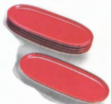
⑩ 朱 小判形おしぼり上 (19.5×8×1.5) (80) 11,000円(五枚組 化粧箱入)