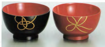
⑤⑥溜・洗朱 夫婦椀 結び (径11.5×6.5) (66) 13,090円(化粧箱入)