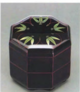
⑧④ 溜 八角二段小重 松竹梅 (12.5×12.5×12) (84) 26,950円(化粧箱入)