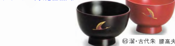
⑤⑤溜・古代朱 腰高夫婦椀 瑞鶴 (径10.5×7) (65) 9,570円(化粧箱入)