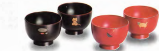
④⑨溜 汁椀 飛行船 ⑤⑩溜 汁椀 ねこ ⑤①古代朱 汁椀 アンブレラ ⑤②古代朱 汁椀 ひつじ (9×6.5)