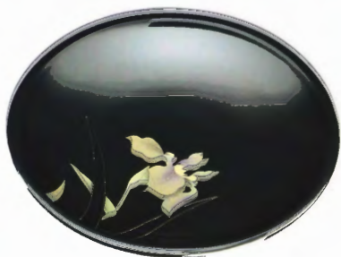
⑧③ 黒 菓子鉢 かきつばた (径24×4) (83) 15,400円(化粧箱入)