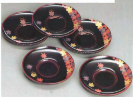
⑧② 溜 茶托 春秋 (径12×2) (82) 17,050円(化粧箱入)