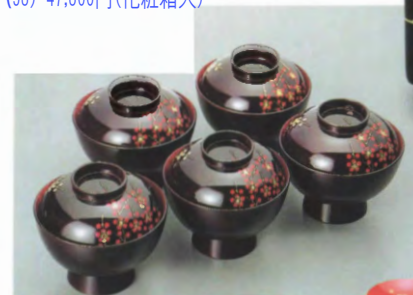
⑨⑤ 溜 雑煮椀 立梅 (径12.5×12) (95) 70,400円(化粧箱入)