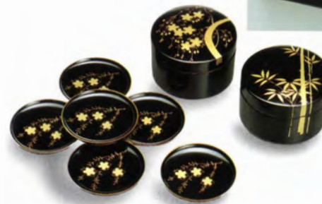
⑦④黒 コースターセット 桜 ⑦⑤黒 コースターセット 竹 (径10×6)