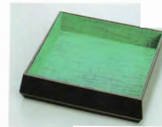
⑤⑨黒 手許箱 (18×18×4) (69) 8,140円(化粧箱入)