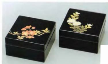
⑤①花の歳時記 小箱 桜 ⑤②花の歳時記 小箱 菊 (9×9×5) (61) 6,930円(化粧箱入) (62) 6,930円(化粧箱入)