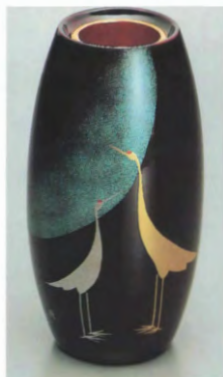
⑧① 黒 胴張花瓶 蒼月 (径11×21)