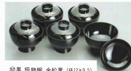
⑨② 黒 吸物椀 金松葉 (径12×9.5) (92) 38,500円(化粧箱入)