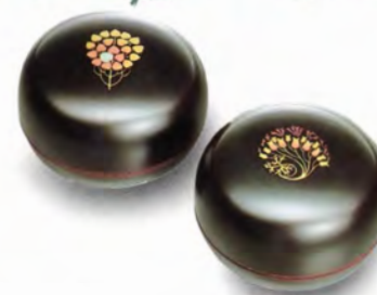
(単位: cm) ⑤⑦溜 小物入 ハートの木 (径10×6) ⑤⑧溜 小物入 花の夢 (径10×6)