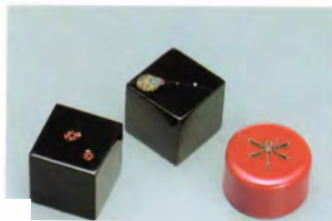
(単位: cm) ④⑤黒 ペーパーウエイト てんとう虫 (4×4×4) ④⑥黒 ペーパーウエイト ほたる (4×4×4) ④⑦朱 ペーパーウエイト とんぼ (径5×2.5)