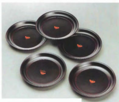
⑧⑥ 溜 椿皿 梅 (径15.5×2.5) (86) 22,000円(化粧箱入)