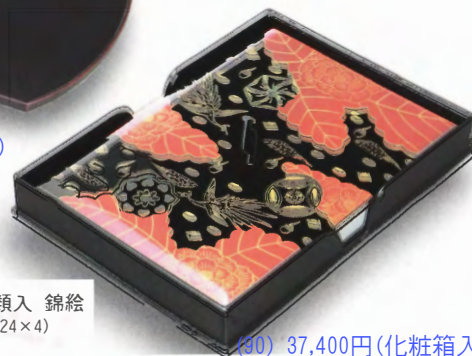
⑨⑩ 黒 書類入 錦絵 (32.5×24×4) (90) 37,400円(化粧箱入)