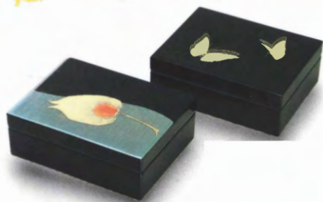
⑦⑧ 黒 小物入 蝶 (14×10.5×5) ⑦ 黒 小物入 ほおずき