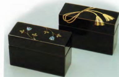
⑦②黒 名刺入 貝入ばら ⑦③黒 名刺入 結び (11×4.5×7.5) (72) 11,000円(化粧箱入) (73) 11,000円(化粧箱入)