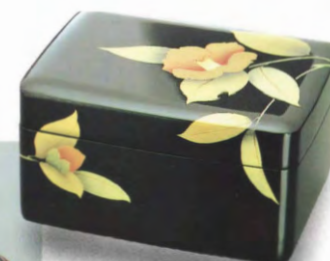
⑨④ 黒 胴張宝石箱 椿 (21.5×15.5×11) (94) 69,300円(木箱入)