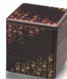
⑨③ 溜 三段重 立梅 (18×18×20) (93) 47,300円(化粧箱入)